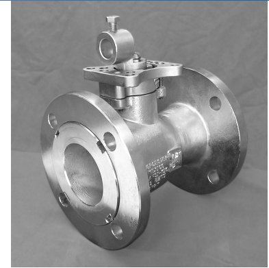
Válvulas de Bola Flotante Floating Ball Valves

Flanged ANSI 150. Reduced port. Light construction in Carbon Steel or Stainless Steel. One piece body design in 1" to 6". Heavy duty seals in a diversity of materials, hermetic double seals in body and stem (optional). Lockable handle, SS ball and stem with anti-static device. Options: ISO 5211 pad, fire safe design according to API 607, API-6D, 3-way and cryogenic.